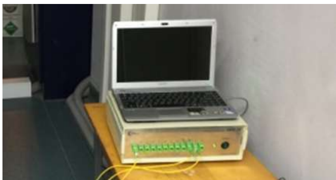
Рисунок 1. Блок управления оптоволоконной системы измерения температуры

«АСИД-12», производство ООО «Оптиз-Мониторинг» (рис. 1), располагался в техническом помещении кабинета МРТ. Датчики были проведены через технологическое отверстие в клетке Фарадея и зафиксированы в центрах пробирок. Для контроля показаний оптоволоконной системы использовался спиртовой термометр.